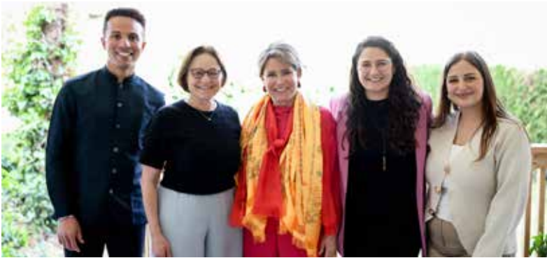
Visite de la Grande-Duchesse Maria Teresa à la Maison NewStep, le 13 mai 2025

Le 13 mai 2025, la Grande-Duchesse Maria Teresa a rendu visite aux résidents de la Maison NewStep ainsi qu'à l'équipe COTEH. Lors de cette visite, elle s'est montrée particulièrement attentive aux victimes, auxquelles elle a exprimé son soutien et apporté réconfort.