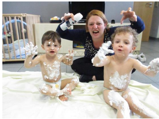
Activité « mousse à raser »