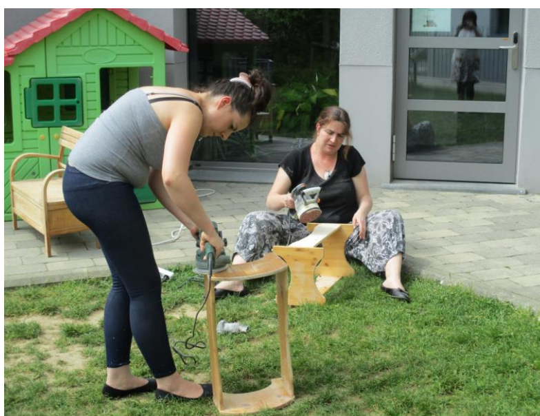
Activité « rénovation des meubles »