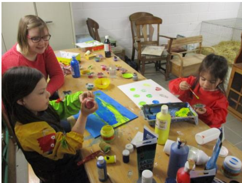
Activité « peinture »