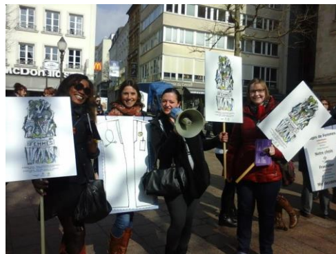
Journée Internationale des femmes