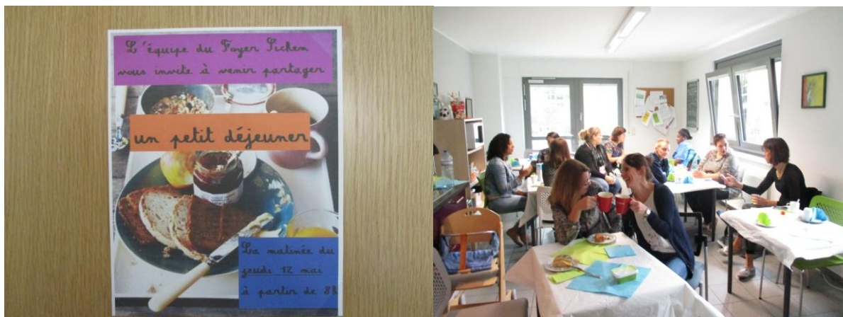
Petit-déjeuner avec les anciennes